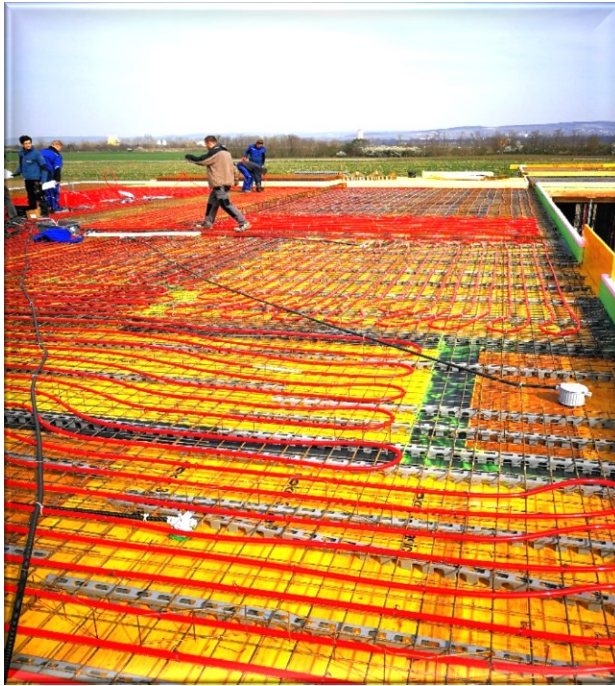
Verlegung der BTA Heizung/Kühlung