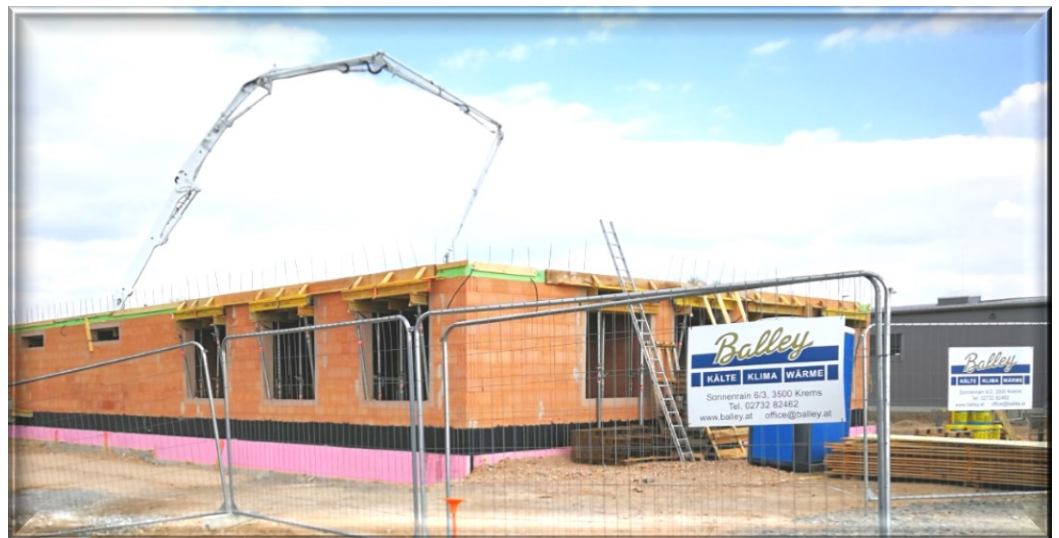
Betonierung der BauTeilAktivierung